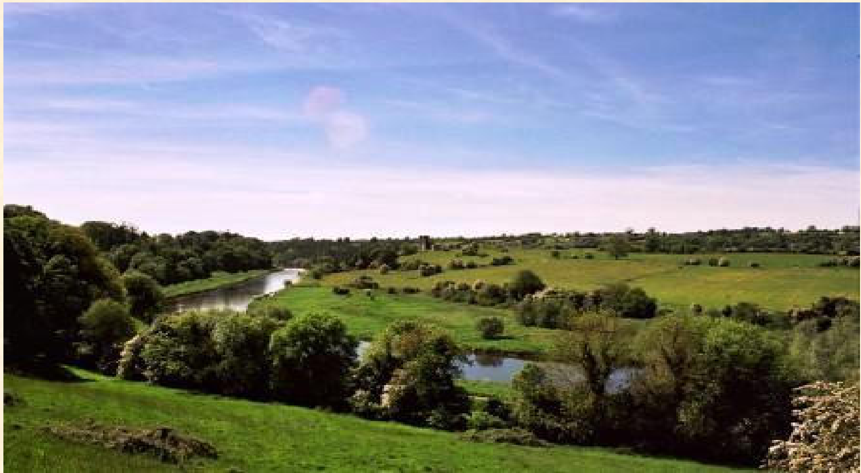
Dolina rzeki Boyne w okolicach Slane, Irlandia